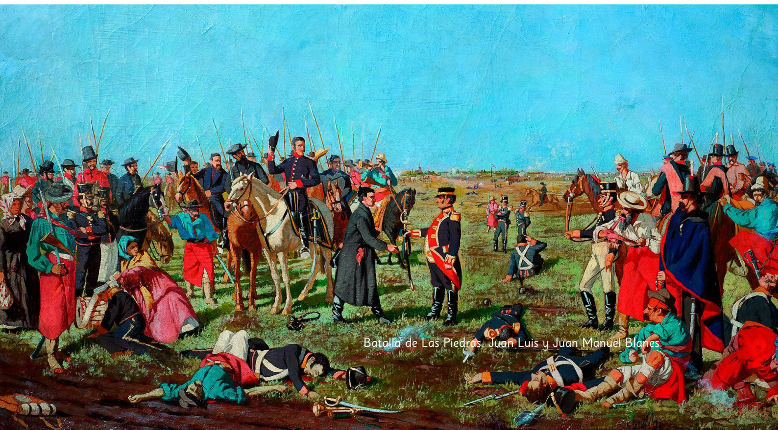
Batalla de Las Piedras, Juan Luis y Juan Manuel Blanes