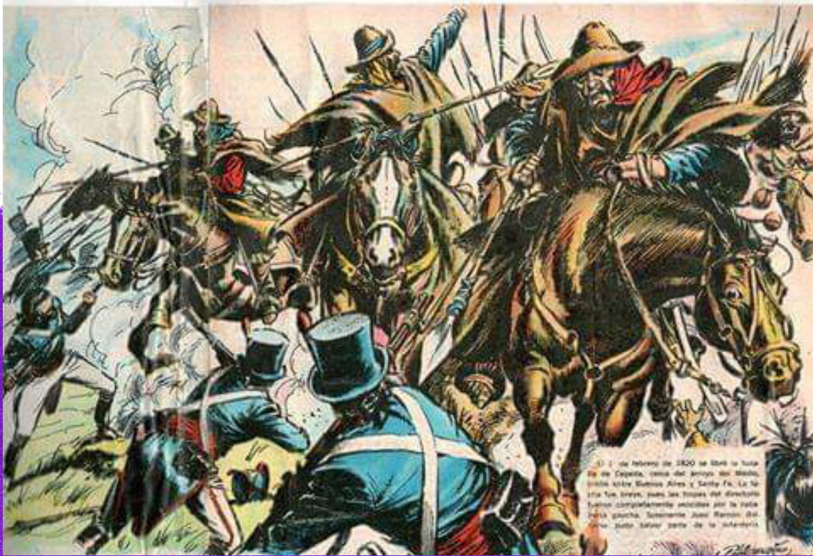
Ilustraciones de la Batalla de Cepeda publicadas en revistas infantiles de la década de 1970