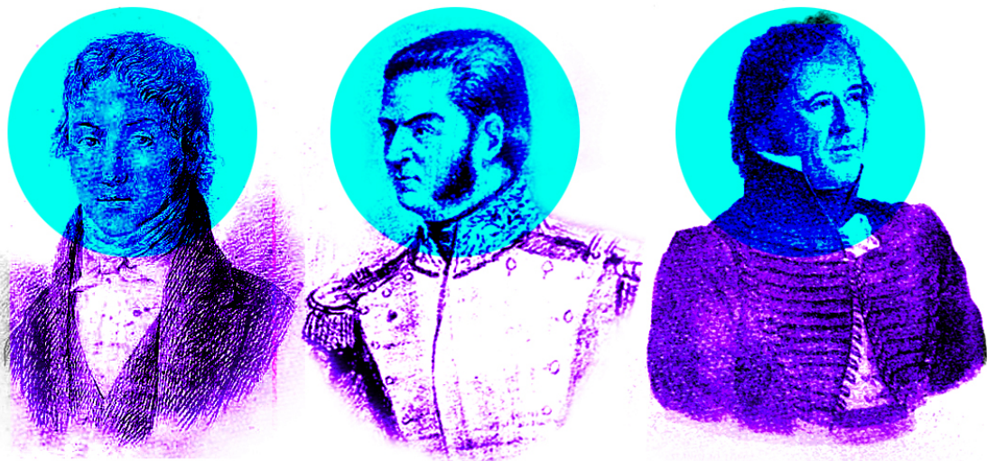
Sarratea, Ramírez y López

El Tratado del Pilar fue firmado el 23 de febrero de 1820 en Pilar, provincia de Buenos Aires, por Manuel de Sarratea (Buenos Aires), Estanislao López (Santa Fe) y Francisco Ramírez (Entre Ríos). El principal objetivo fue darle fin a los conflictos entre las provincias que habían desembocado en la Batalla de Cepeda, en la que un ejército de fuerzas federales (a cargo de Ramírez y López) venció a las tropas del Directorio Supremo que, luego de la derrota, se disolvió.