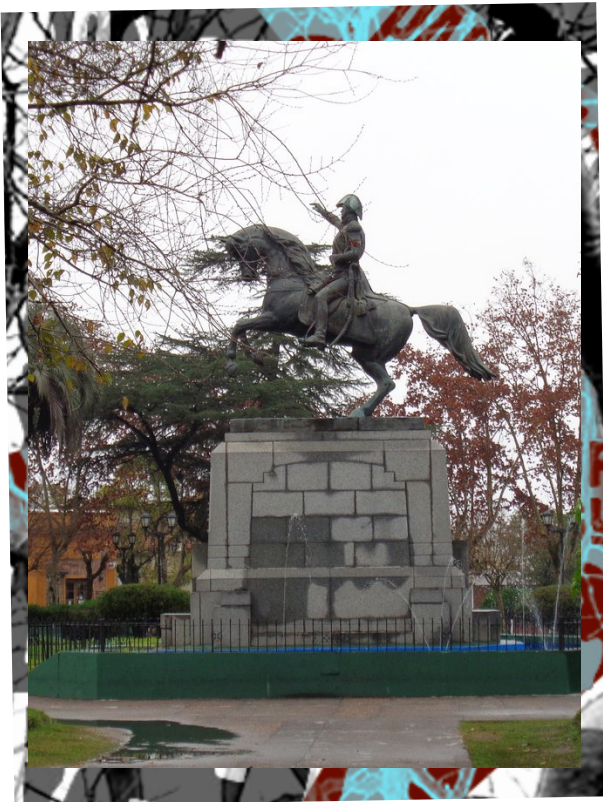
★Monumento a San Martín en Colón