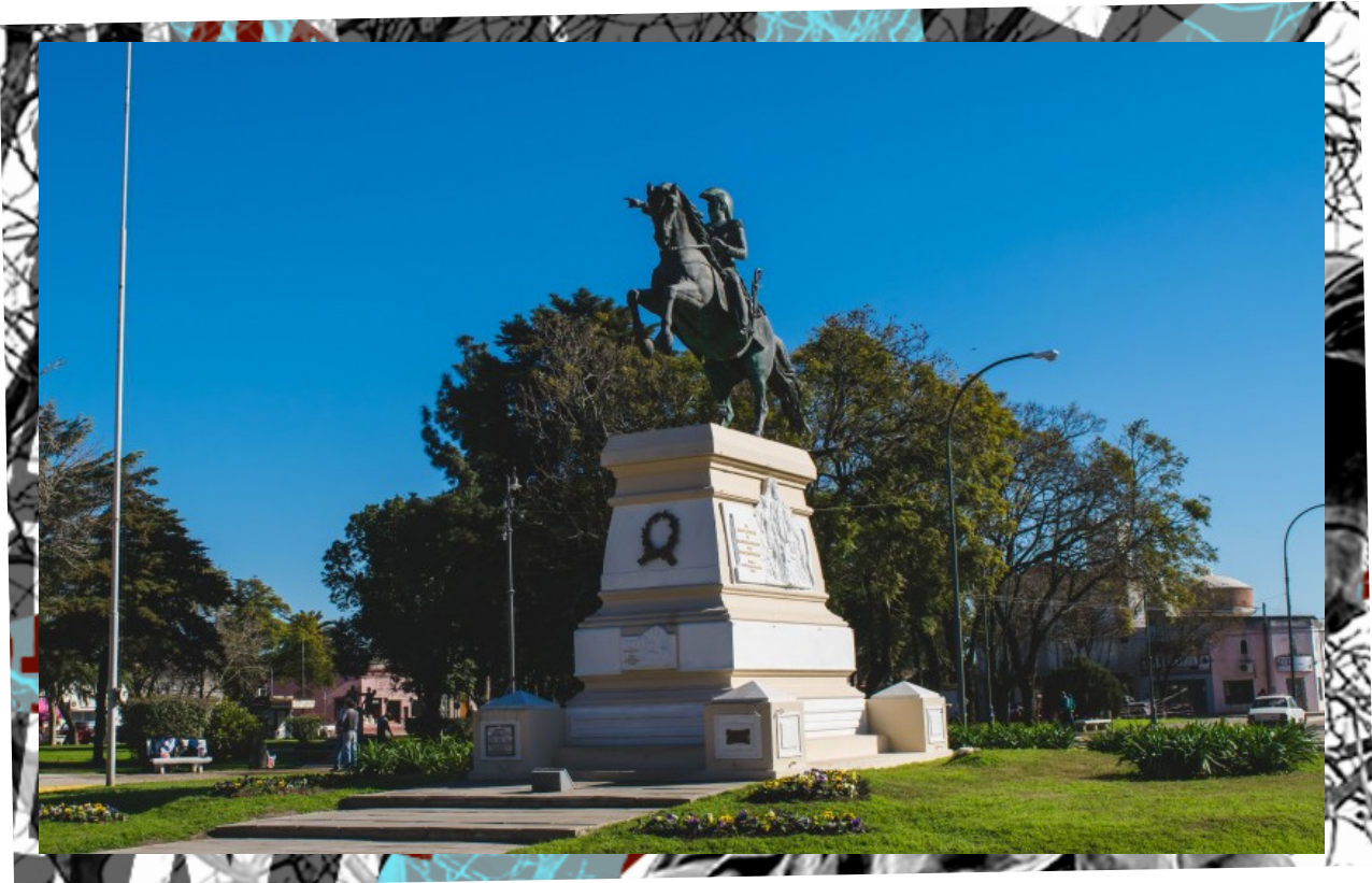
★Monumento a San Martín en Gualeguay