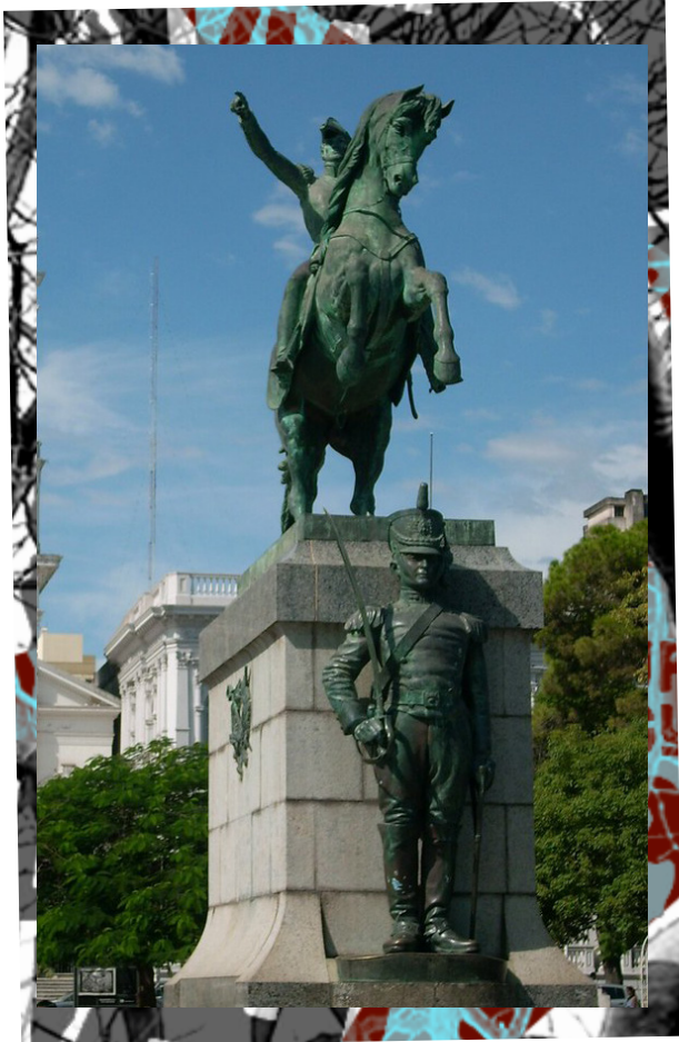
★Monumento a San Martín en Paraná