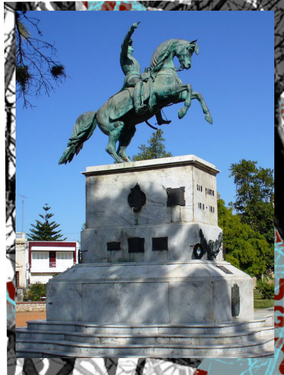
★Monumento a San Martín en Victoria