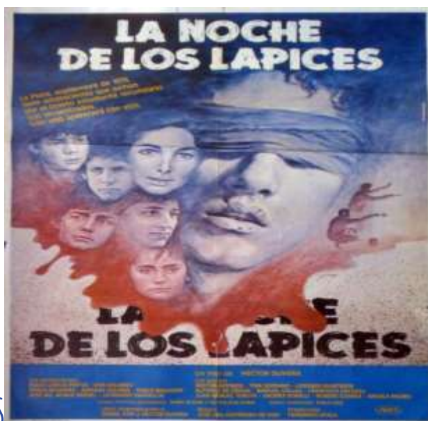
LA NOCHE DE LOS LÁPICES

La represión incluyó la organización de centros clandestinos de detención, los cuales se emplazaban en predios militares o espacios preparados para tal fin y que hoy están claramente identificados como “espacios de memoria”. En la Ciudad de Buenos Aires, podemos mencionar la ex ESMA (Escuela de Mecánica de la Armada), en la ciudad de Paraná; el actual Museo de Bellas Artes fue otro de los centros más importantes de la zona, como también los predios militares.